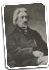
משה הס

קראו בעמוד 180 למעלה וכתבו שלושה רעיונות בהם האמינו מבשרי הציונות: