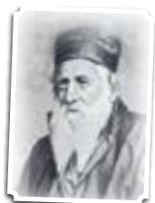
הרב יהודה אלקלעי (ויקיפדיה)

קראו את הקטע מספרו של הרב אלקלעי המובא בעמוד 178 וענו על השאלות הכתובות מתחתיו: