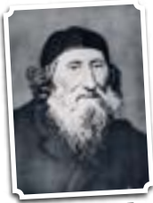
הרב צבי קלישר (ויקיפדיה)