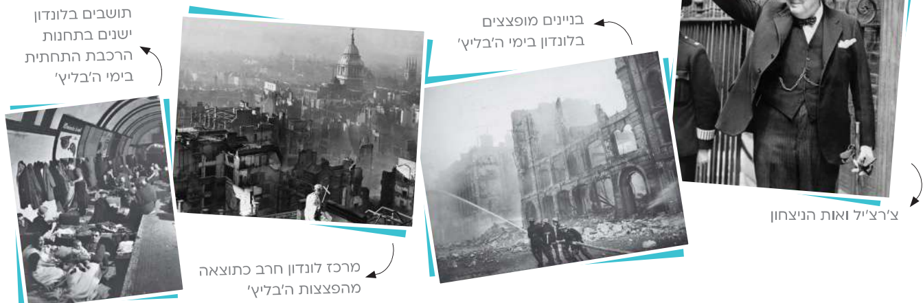
תושבים בלונדון ישנים בתחנות הרכבת התחתית בימי ה'בליץ'

משנכחו הנאצים כי הבריטים אינם מתכוונים להיכנע, החליטו לעשות כל מאמץ כדי לשבור את רוחם. חיל האוויר הגרמני, שנהנה מעליונות אווירית ניכרת על פני חיל האוויר הבריטי, החל בהפצצות מסיביות על ערי בריטניה, זרע הרס וגרם אבדות