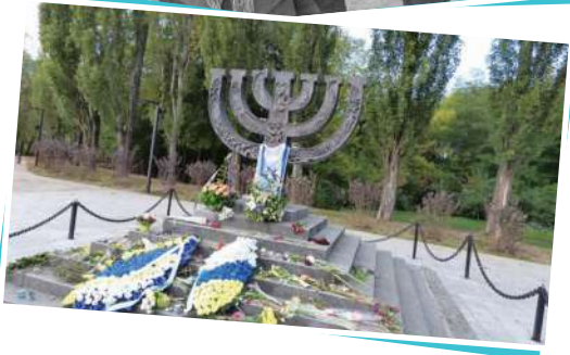
אנדרטה לזכר הנרצחים היהודים המוצבת בבאבי-יאר, הסמוכה לקייב בירת אוקראינה. באתר זה נרצחו בידי הנאצים ואוקראינים מקומיים שסייעו להם לפחות 50,000 מיהודי העיר.

בעוד הגרמנים מבצעים מעשי זוועה חסרי תקדים בשטחים שנכבשו על ידם, החל הצבא האדום להתארגן מחדש. לחימה עיקשת האטה את התקדמות הגרמנים, וניסיונם לכבוש את מוסקווה נכשל. בלחץ הצבא הרוסי הם אף נאלצו לסגת משטחים באזור מוסקווה שאותם כבשו. לוחמת גרילה של פרטיזנים (על מושג הפרטיזנים כלוחמים לא סדירים הלוחמים בצבא סדיר למדתם בפרק ן רוסים שהחלה להתפתח בעורף הכוחות הגרמנים הפריעה להתנהלותם יותר ויותר, למרות מעשי ענישה אכזריים שביצעו הגרמנים כלפי כל מי שנחשד בשיתוף פעולה עם הפרטיזנים. מעל הכול חורף רוסי קשה הקשה על הגרמנים להמשיך במתקפת הבזק שלהם, והצבא הגרמני נאלץ לעצור במקום ולהתמודד עם הכפור והמתקפות הרוסיות שהלכו וגברו. בינתיים, בצידו השני של העולם, התרחשו אירועים דרמטיים שהשפיעו גם הם על גורל המלחמה.