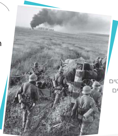
תושבים נמלטים מבתים הרוסים בלנינגרד

כוחות גרמניים חוצים את הגבול הרוסי עם תחילת מבצע ברברוסה