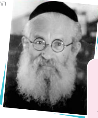
הרב יצחק הרצוג