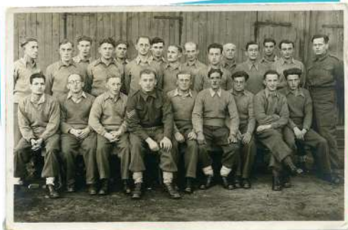
חיילים מארץ ישראל שנפלו בשבי הגרמני בעת המערכה ביוון

האיטלקים ביקשו לכבוש שטחים גם באפריקה. עוד לפני המלחמה הוביל מוסוליני מערכה כושלת לכיבוש אתיופיה, וכעת ניסו כוחותיו לפלוש מלוב, שהייתה בשליטת איטליה, למצרים, שהייתה תחת שלטון בריטי. גם במקרה זה הובסו הכוחות האיטלקיים בידי הצבא הבריטי, שכבש שטחים נרחבים מלוב. לעזרת האיטלקים שלח היטלר את הטוב שבמצביאים הגרמנים – גנרל ארְוין רֹמֶל שכונה "שועל המדבר". רמל הוביל את הכוחות הגרמניים לניצחון אחר